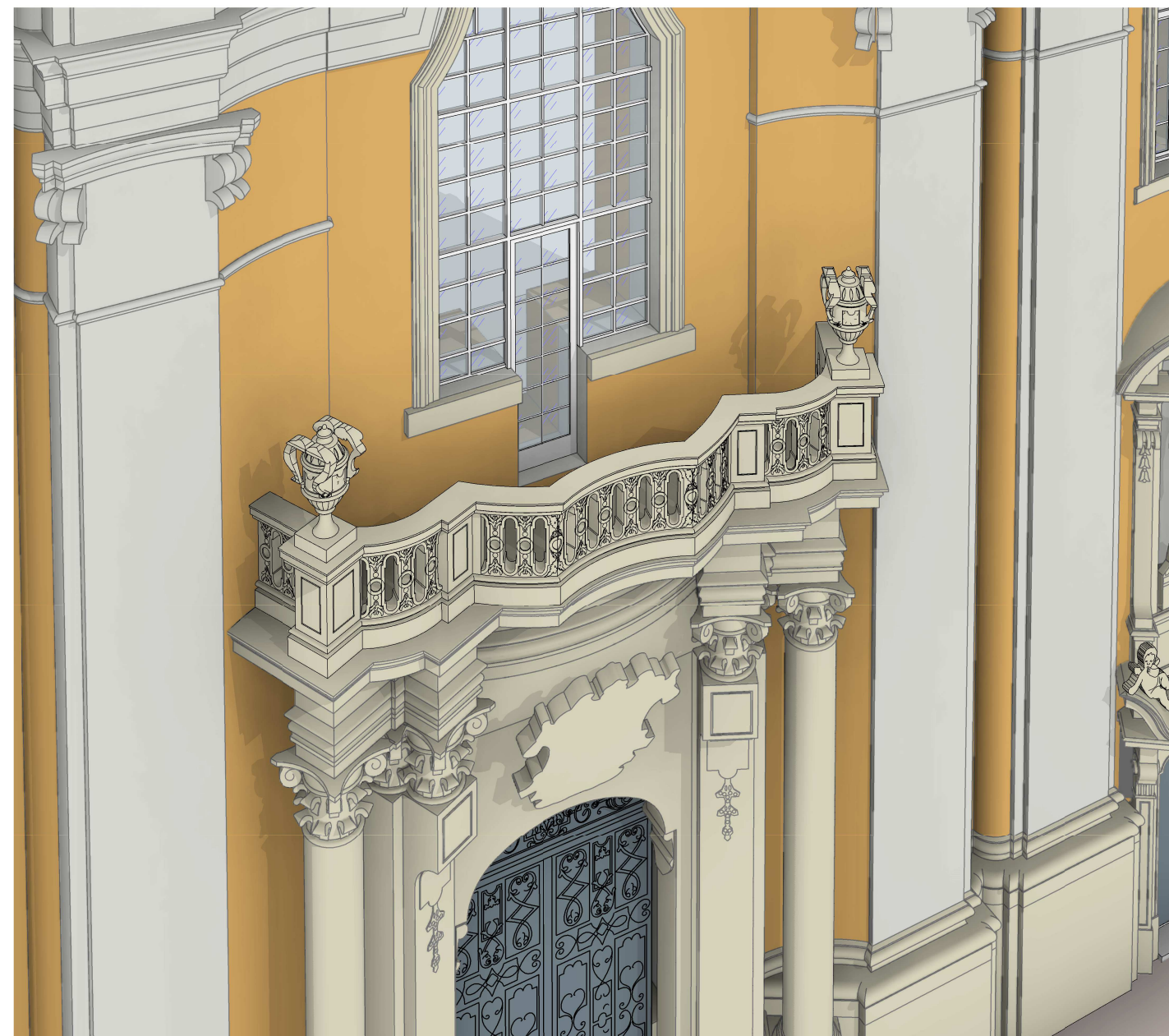
Balustrada-widok od strony północnej z lotu ptaka