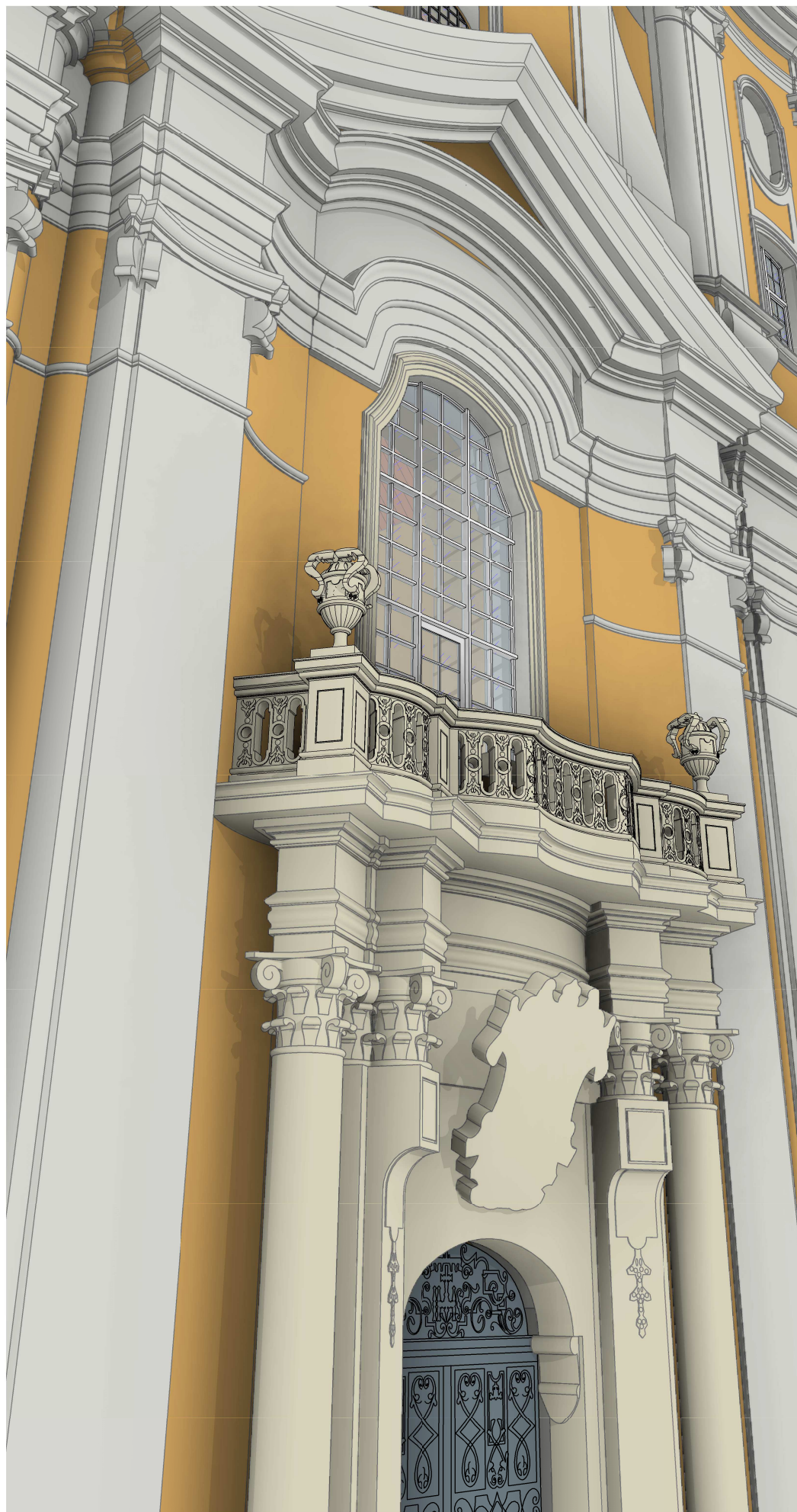
Balustrada-widok od strony północnej